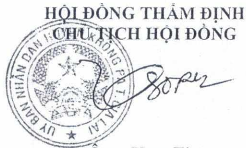
Ông: Ksor Tin PHÓ CHỦ TỊCH UBND HUYỆN